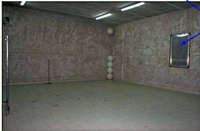
Fenêtre de mesures